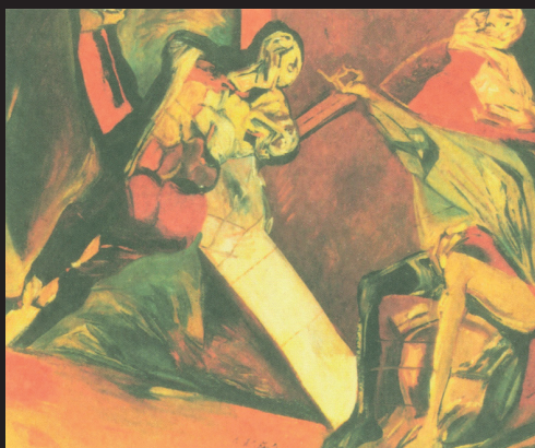
Pozvanie (olej, 1978)