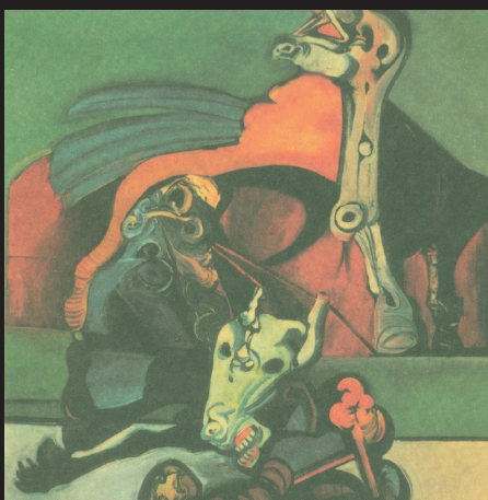
Zobák (olej, 1982)