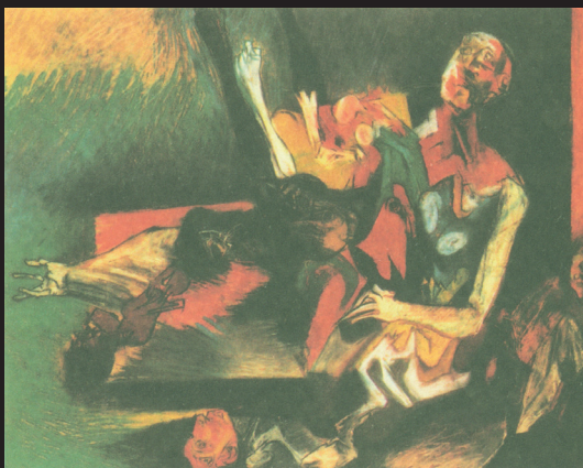
Na stole (pastel, 1990)