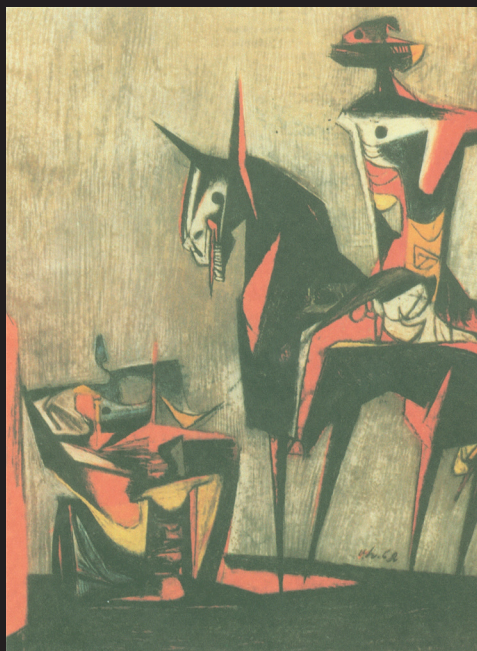
Jazdec II. (pastel, 1962)