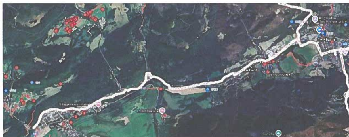
Podklad č. 2