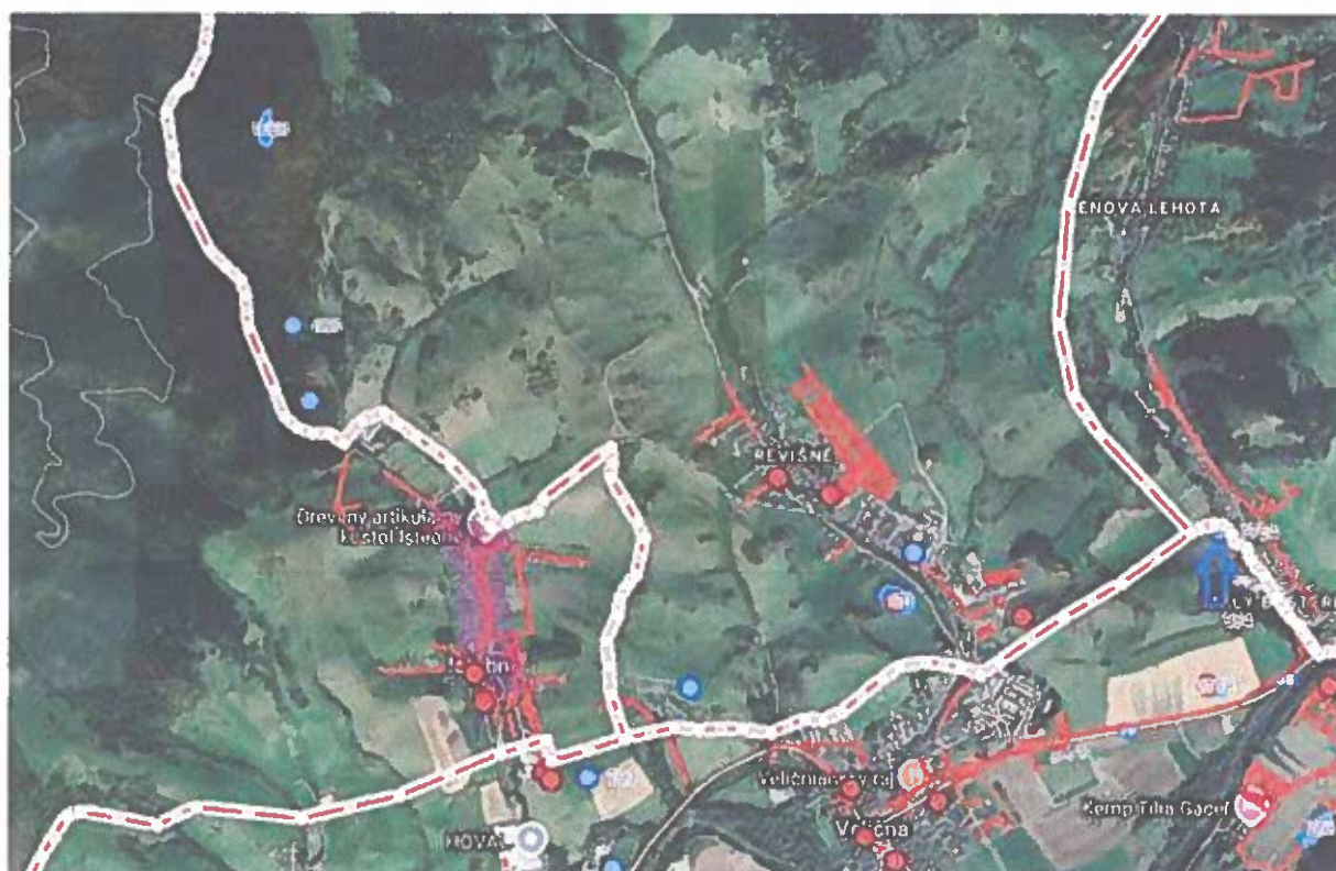
Podklad č. 3